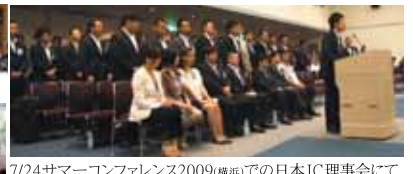
私たちの想いを九州の仲間たちへ発信!!